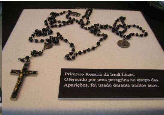
Primeiro Rosário da Irmã Lúcia. Oferecido por uma peregrina ao tempo das Aparições, foi usado durante muitos anos.

Il 2017 enfatizzerà maggiormente tre oggetti dell'epoca delle apparizioni: il primo Rosario che è stato offerto a Lucia, la corda che ha usato come cintura con i suoi cugini Giacinta e Francesco e il foulard che Lucia portava in testa durante le apparizioni della Madonna.