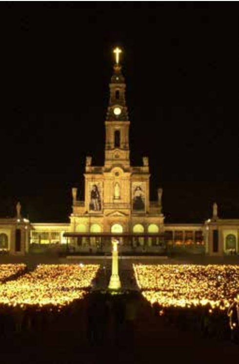
Santuário da Nossa Senhora de Fátima à noite.

Como vejo a Mensagem através do tempo sem tempo, porque nos planos de Deus, na Luz do Seu Imenso Ser, ela sempre foi como se fora actual, naquele momento, por Ele marcado para aquele dia, hora e instante, porque no espelho imenso do seu Ser Divino, tudo está presente sem passado nem futuro.