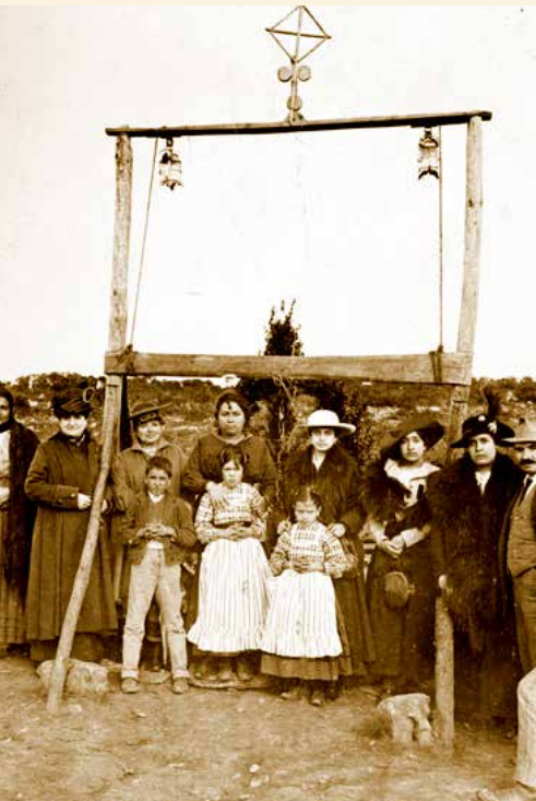
Peregrinos de Fátima com os três pastorinhos, 1917.

No final de 2014 foi-me lançado o desafio de colaborar como membro da Comissão Histórica na Causa de Beatificação da Ir. Irmã Maria Lúcia de Jesus e do Coração Imaculado, O.C.D. Até então – reconheço – o meu conhecimento sobre «Fátima» limitava-se ao que é comumente conhecido: as aparições e o seu contexto histórico, as personagens centrais, ou seja, os «três pequenos pastores» e a figura, algo enigmática e distante, da própria pastorinha mais tarde Religiosa Carmelita, a Irmã Lúcia.