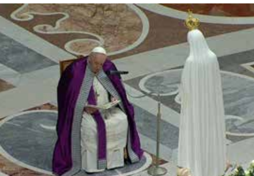
El Papa Francisco durante el acto de consagración de Rusia, Ucrania y el Mundo al Corazón Inmaculado de María, Vaticano, 25 de marzo de 2022.

La Hermana Lucía confirmó personalmente que este acto solemne y universal de consagración correspondía a lo que Nuestra Señora quería: «Sí, se ha hecho como Nuestra Señora lo pidió, desde el 25 de marzo de 1984» (carta del 8 de noviembre de 1989)» (Memórias da Irmã Lúcia I, Apêndice III, 10ª Ed., 2005, p. 202).