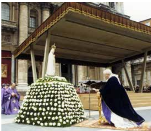
Papa João Paulo II durante o ato de consagração do mundo ao Imaculado Coração de Maria, Vaticano, 25 de março de 1984.

Posteriormente, o papa Paulo VI, no dia 21 de novembro de 1964, discursando no encerramento da terceira sessão do Concílio Vaticano II, consagrou o género humano ao Coração Imaculado de Maria, mas mais uma vez a consagração não fora realizada segundo os pedidos da Virgem Maria.