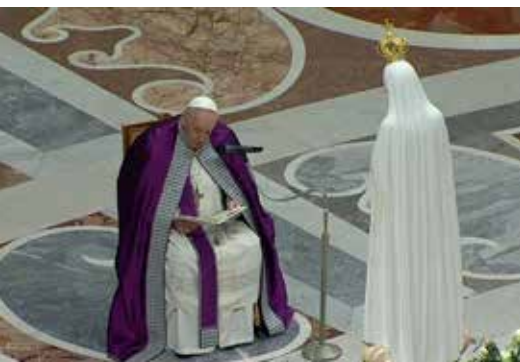
Papa Francisco durante o ato de consagração da Rússia, da Ucrânia e do mundo ao Imaculado Coração de Maria, Vaticano, 25 de março de 2022.

A Irmã Lúcia confirmou pessoalmente que este acto, solene e universal, de consagração correspondia àquilo que Nossa Senhora queria: «Sim, está feita tal como Nossa Senhora a pediu, desde o dia 25 de Março de 1984» (carta de 8 de Novembro de 1989) (Memórias da Irmã Lúcia I, Apêndice III, 10ª Ed., 2005, p. 202).